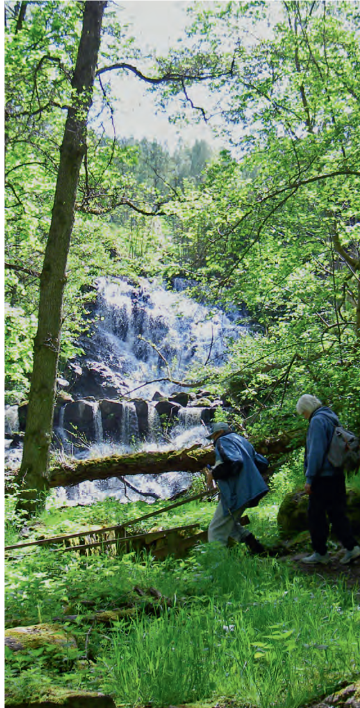
Forsen vid Röttle